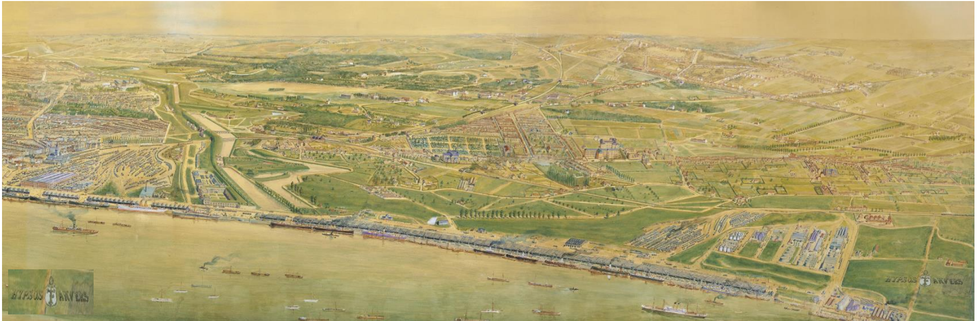
De rede van Antwerpen ten zuiden van de stad (rechter gedeelte van de Hypsoskaart). Links het reizigers-, goederen- en rangeerstation Antwerpen-Zuid, rechts het rangeerstation Antwerpen-Kiel, daarnaast de petroleuminstallaties en uiterst rechts de industrie op het grondgebied van Hoboken.