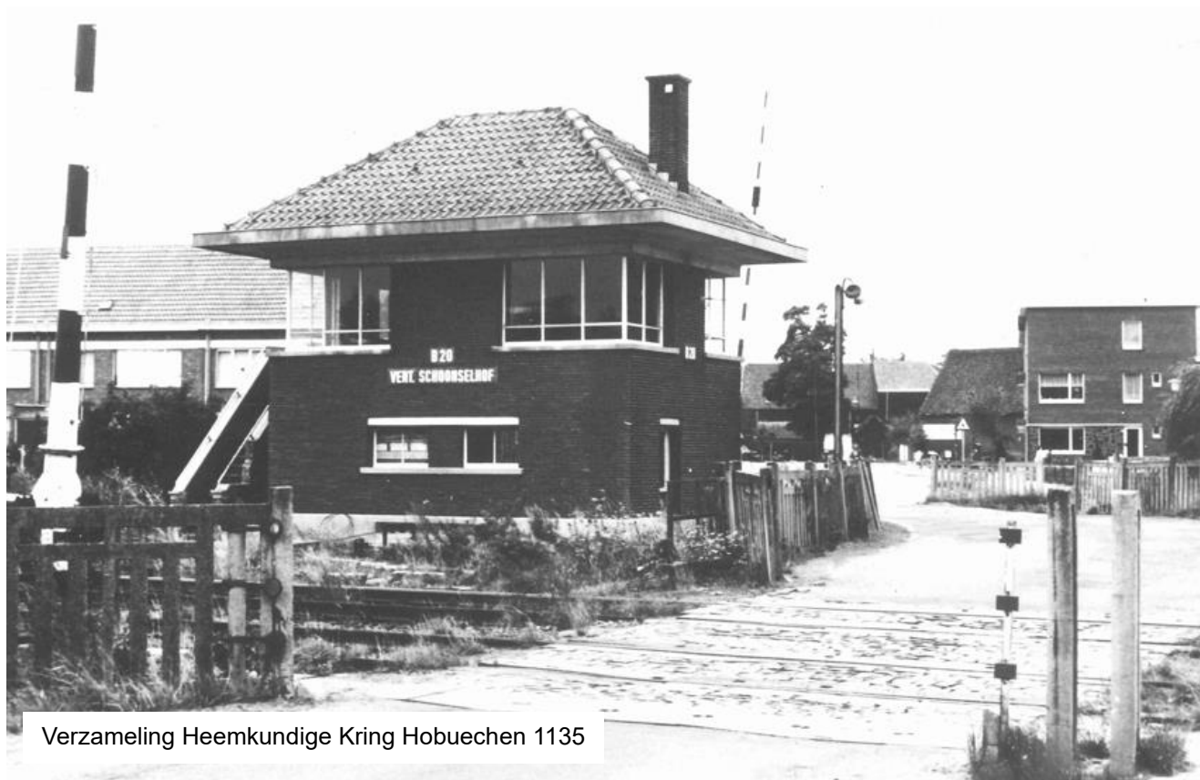
Verzameling Heemkundige Kring Hobuechen 1135

seinen en wissels van de vertakking Schoonselhof en de slagbomen van de overweg met de Broydenborglaan bediend werden. De blokpost (Blok 20) bevond zich tussen de sporen van de fortenlijn en deze van lijn 52/1.