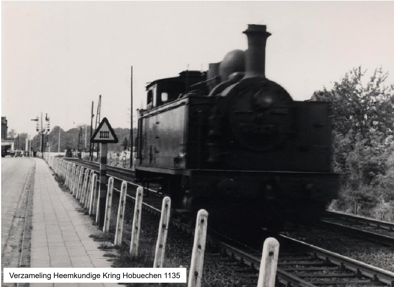
Verzameling Heemkundige Kring Hobuechen 1135

Aanvulling bij de versie 2024 09 03: de volgende foto's moeten toegevoegd worden achter blz. Fortenlijn / D-17.