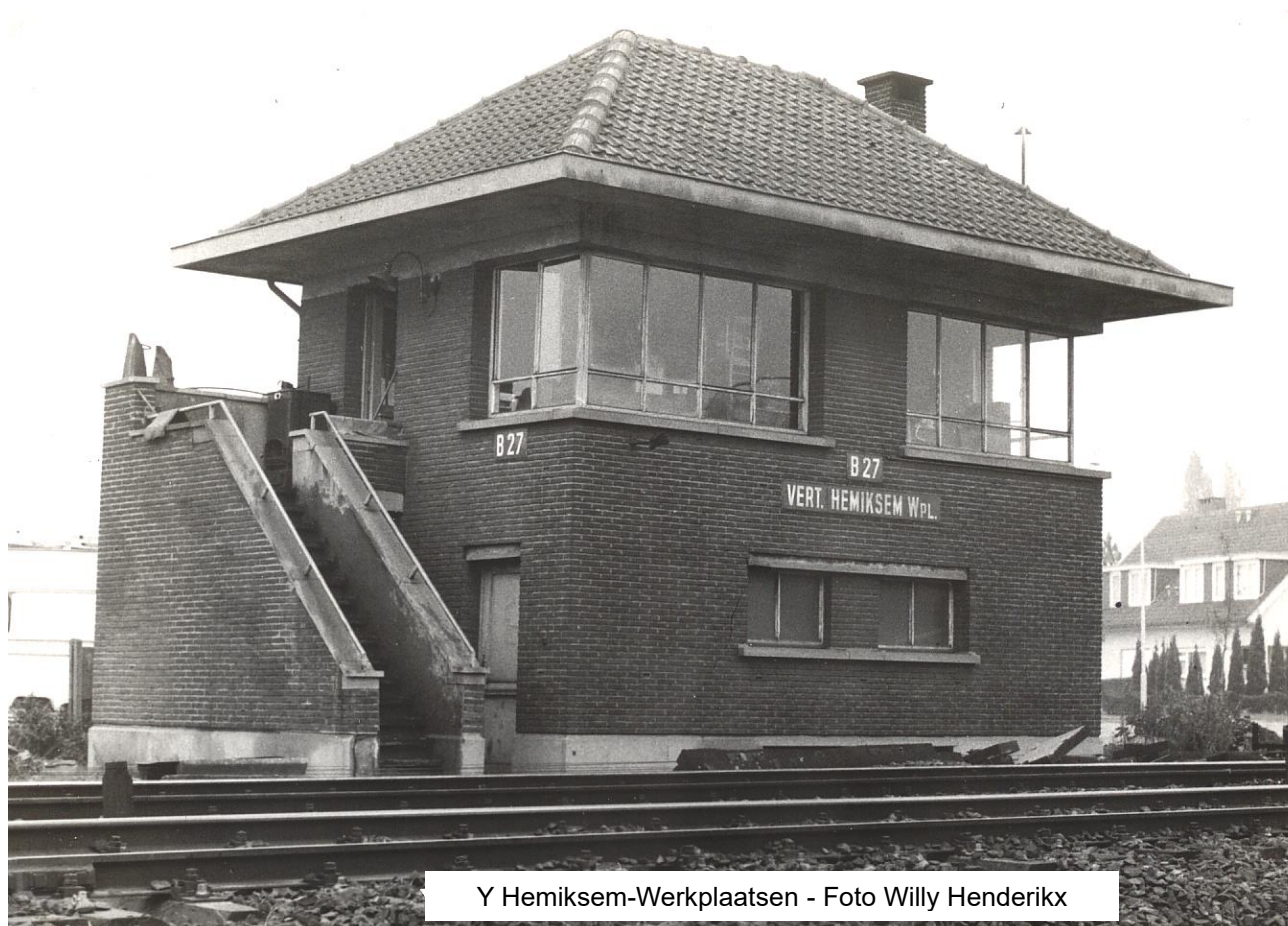
Y Hemiksem-Werkplaatsen

Op de foto van blz. Fortenlijn / D-10 is deze blokpost op de achtergrond vaag zichtbaar. Deze foto toont de blokpost in volle glorie.