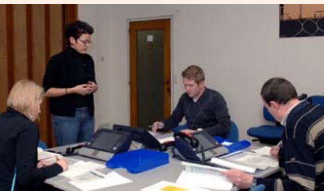
Exercices avec les nouveaux outils Etrali