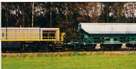
De 'Europ-wagen- gemeenschap' verdwijnt