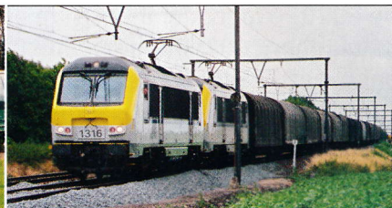
Athus-Meuse: indienststelling in december