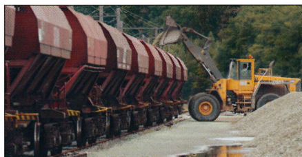
B-Cargo, een sterke schakel in de recyclage van glas