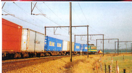
POLAND CARGO EXPRESS IFB start een nieuwe rechtstreekse spoorverbinding tussen België en Polen