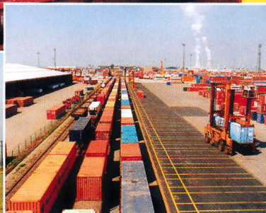
NMBS-VRACHTGROEP 4 complementaire polen