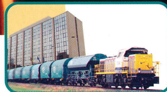
Verhuis van B-Cargo