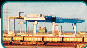
Werken ring Antwerpen: oplossingen van IFB