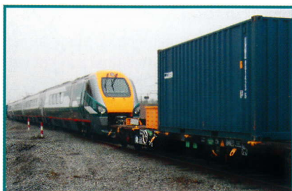
Uitzonderlijk transport naar Engeland

B-Cargo past structuur aan om haar klanten beter te dienen